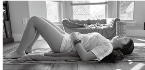
図4: 腰背中をベッタリと床につけて頭を落とします。頭はバスタオルの外に置きます